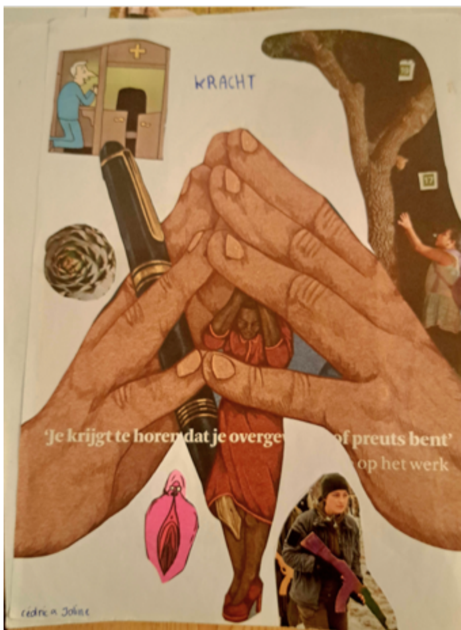
Moodboard rond het relaas

* https://drive.google.com/drive/u/2/folders/17Nw3AAXiVvdAkRgWJZaAl03px8fW65Cu